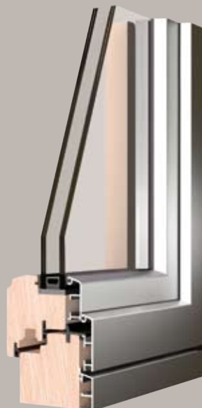
Sistema 5000/S design moderno e linee squadrate.

La gamma dei profili è molto ampia ed è in grado di soddisfare ogni esigenza costruttiva. Nel sistema 5000/S può essere utilizzata la serie di accessori e guarnizioni che consente di evitare l'uso di viti nell'assemblaggio dei telai in alluminio sul legno, che permette un sensibile risparmio di tempo ed evita ogni possibilità di errore nel posizionamento delle clips.