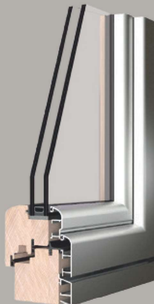
Sistema Soft-Line design armonioso e linee arrotondate

La gamma dei profili è molto ampia ed è in grado di soddisfare ogni esigenza costruttiva. Nel sistema Soft-Line può essere utilizzata la serie di accessori e guarnizioni che consente di evitare l'uso di viti nell'assemblaggio dei telai in alluminio sul legno, che permette un sensibile risparmio di tempo ed evita ogni possibilità di errore nel posizionamento delle clips.